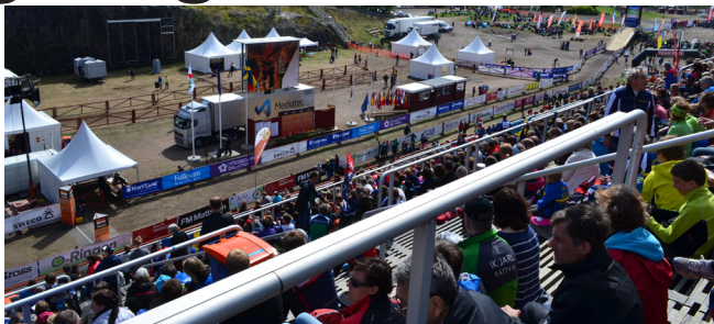
EM-läktaren. NOK:are på plats på läktaren när EM avgjordes.

Efter två tävlingsdagar i Skattungbyn for vi hem för att pendla till de två sista