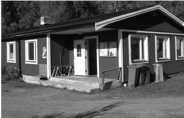
NOK-STUGAN. Vår fina klubbstuga i Nordansjö.