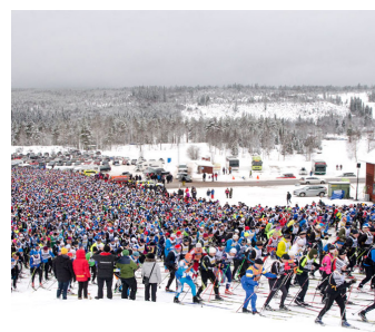
Första backen