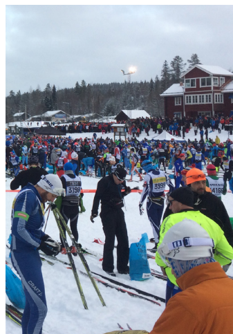
Johans vy strax före start