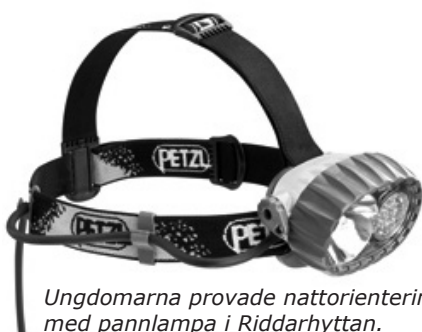
Ungdomarna provade nattorientering med pannlampa i Riddarhyttan.