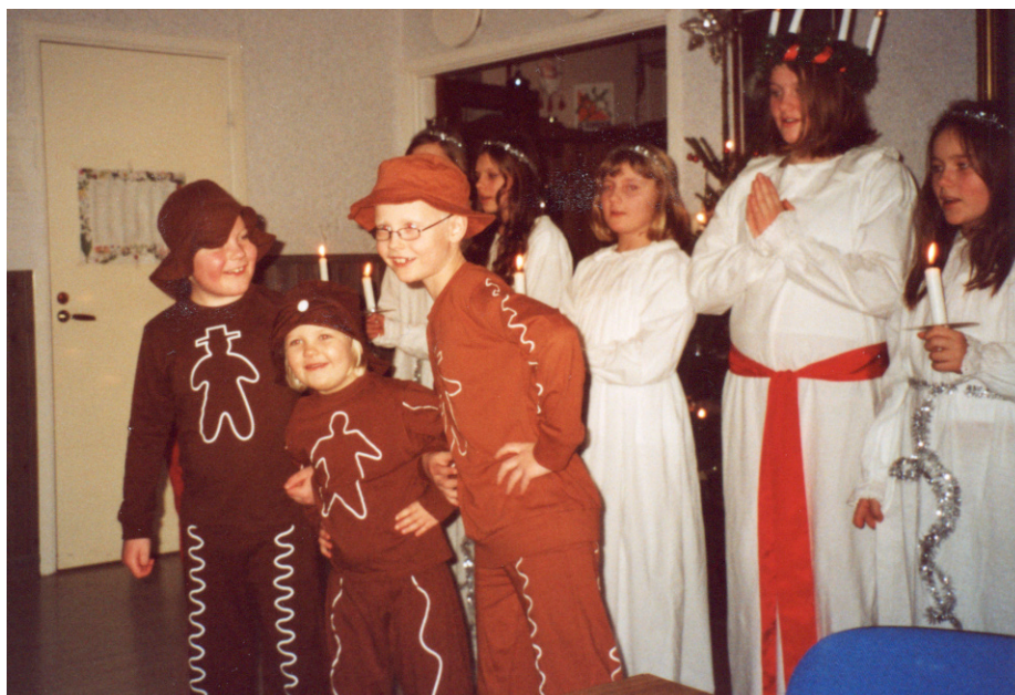
Luciatåg. Med pepparkaksgubbar som sjunger Vi komma ...

Efter att vi hade bakat så fortsatte vi att träna sånger och att gå in och